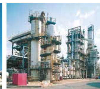
残油流動接触分解装置

原料である重油を高温低圧雰囲気中で触媒と接触させることで分解し、プロピレン・LPG・ガソリン留分を製造します。